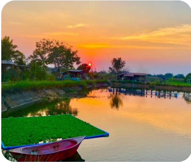
แหล่งน้ำธรรมชาติ